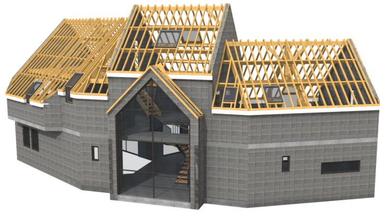
CONSTRUCTION D'UN PAVILLON CONTEMPORAIN