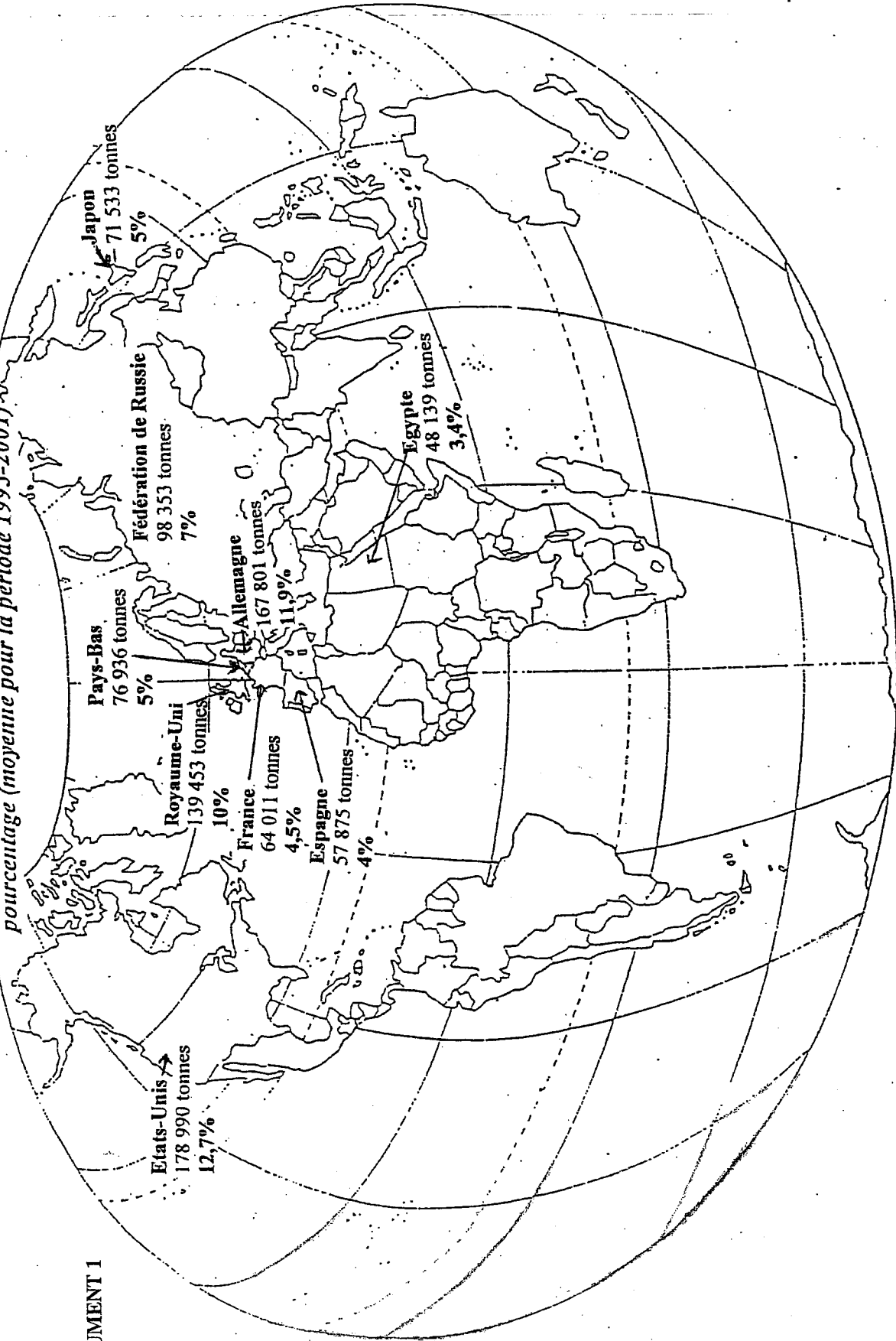
Carte des importations de tabac brut par grands acteurs en tonnes et en pourcentage (moyenne pour la période 1995-2001)