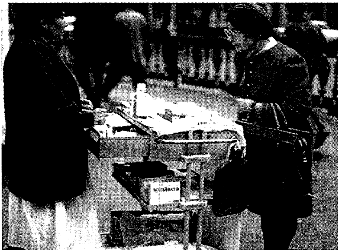
Médicaments sur un étal à Tachkent en Ouzbékistan pays situé au nord de l'Afghanistan (voir document 3) -1999 documentation française n°8015 juin 2000